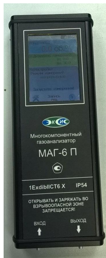
Рисунок 2 – Внешний вид газоанализатора МАГ-6 исполнения МАГ-6 П-Т