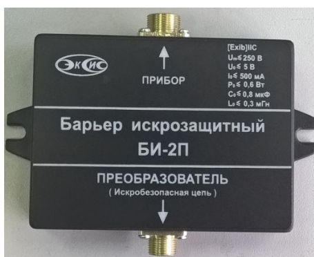
Рисунок 8– Внешний вид барьера искрозащиты БИ-2П