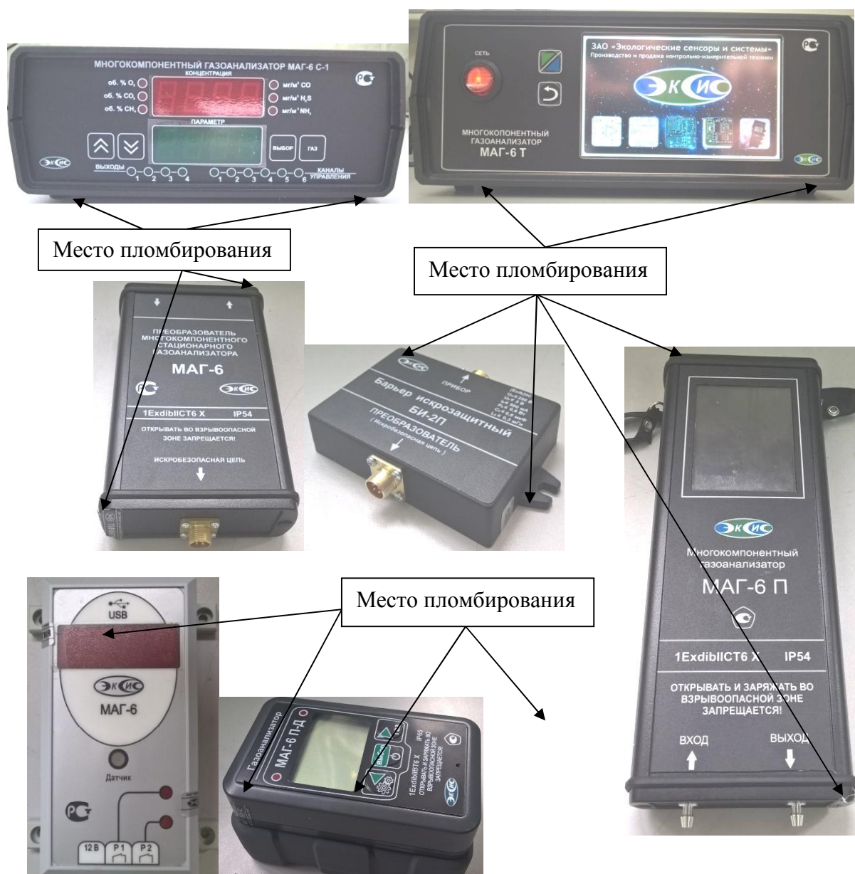
Стрелками указаны места пломбирования от несанкционированного доступа Рисунок 9 Схема пломбирования газоанализаторов от несанкционированного доступа